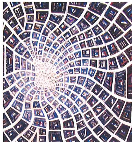
「時空の扉 Door of the Space」2005年