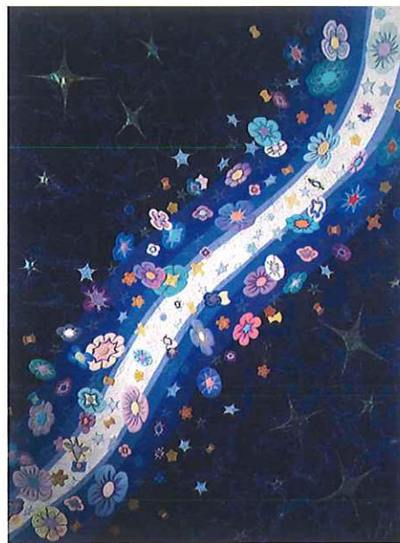
「大河の舞 The dance of the big river」2014年

キルト制作30年を迎えた節目の本年、オリジナルにこだわり制作してきた初期作から最新作を一堂に展示し、作家活動を紹介します。作風の変遷は驚きをもってご覧いただけるでしょう。確かな技術のもと、彼女が作り出す珠玉のHappyなキルト作品をお楽しみください。